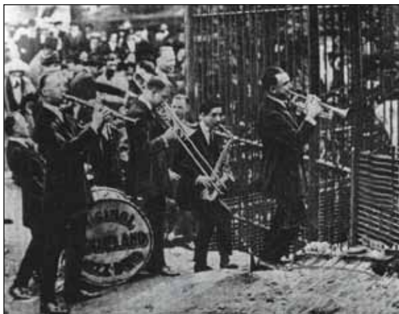
De dieren in de zoo kunnen de klanken wel waarderen.

in de dierentuin. Een aantal geleerden (biologen en fysiologen) bestudeerde, op aandringen van een psycholoog, de reactie van dieren op jazzmuziek. Het succes was groot: olifanten en een ijsbeer bleken het schitterend te vinden; ook de apen waren wild enthousiast. De teloorgang van de O.D.J.B. was door de evoluerende muziek, die jazzmuziek nu eenmaal is, niet te stuiten en de band viel uit elkaar.