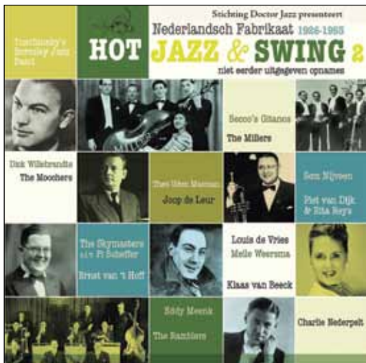
Hot Jazz - Swing - 1926 - 1953