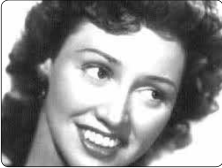
Zangeres Anita O'Day

Het was niet zo moeilijk voor Gene om een groot orkest samen te stellen, zijn naamsbekendheid zorgde er ook voor, dat hij direct kon beginnen in 'The Steel Pier' in Atlantic City. De show werd natuurlijk geheel gemaakt rond het spectaculaire drumwerk van Gene Krupa. Gene speelde