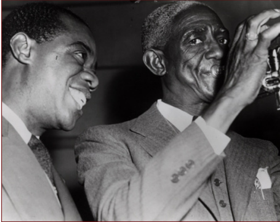
Met de goedkeurende blik van Armstrong

Bunk was welhaast een nationaal figuur geworden, hij speelde avond aan avond in het Stuyvesant Casino; verdiende $200,-- per week en kookte zijn eigen potje bonen op zijn hotelkamer. Het geld stuurde hij naar mama in New Iberia. Toch begon het wat tegen te vallen, er werden nog wel wat platen gemaakt, maar de belangstelling van het publiek om te dansen, verloor het van degenen die kwamen luisteren en dat kostte geld. In 1947 liep zijn contract bij het Stuyvesant Casino af en hij ontbond zijn orkest. George Lewis zou later - met nagenoeg dezelfde orkest- bezetting - wereldvermaard worden, maar dat heeft de oude meester niet meer meegemaakt. Wel maakte Bunk Johnson in 1947 - met een compleet andere bezetting dan voorheen - nog een lp voor het Columbia label (Columbia-829). In Nederland uitgebracht op het Philips