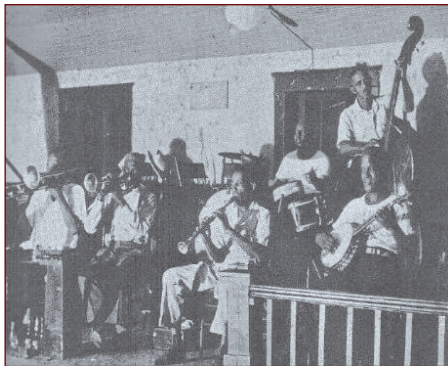
Optreden in het Stuyvesant Casino New York

frisco muzikanten heen en de grammofoonplaten werden goed verkocht. Na een jaar hield hij het wel voor gezien en ging terug na New Iberia, waar hij weer het land ging bebouwen. Onwetend, over wat zijn terugkomst in de muziek teweeg had gebracht, ontstond er in New York, een 'revival' beweging, die de heimwee naar de oude N.O.- jazz muziek in ere wilde herstellen.