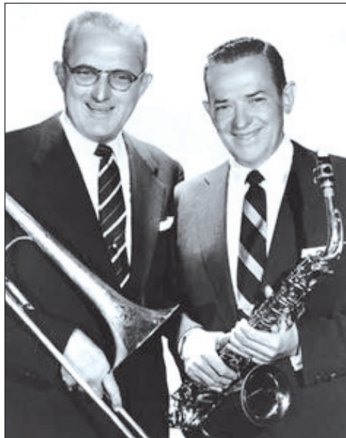
Jimmy en Tommy Dorsey

De in 1947 gemaakte film 'The Fabulous Brothers Dorsey', volledig te zien op het internet, is natuurlijk een zwak afgietsel over het leven van twee geweldige muzikanten, die in hetzelfde gezin opgroeiden, waarbij vader Dorsey, als hij niet in de kolenmijn moest werken, zijn zoons