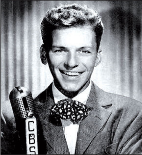
De nog onbekende Frank Sinatra 'I'll never smile Again'

Klopte allemaal prima. Veel is er gespeculeerd over de manier waarom de samenwerking tussen Frank Sinatra en Tommy Dorsey is gestopt. Bepaalde kringen beweerden dat zijn contract met het Dorsey orkest zijn verdere succes in de weg stond en dat er zelfs bedreigingen aan te pas zijn gekomen, maar dat laten we maar in het midden. Zestien van zijn bekendste opnamen, met Tommy Dorsey, zijn uitgebracht door RCA-Victor/dubbel elpee/43586 en ongetwijfeld zijn ze ook op cd te verkrijgen. Jimmy Dorsey kreeg in het begin van de jaren veertig wat tegenslagen te verwerken en moest zijn orkest ontbinden, maar toch was hij snel weer op de been om door te gaan en een jaar later startte hij met een nieuw orkest. Helaas, de Tweede Wereldoorlog was na 7 december 1941 ook voor de Verenigde Staten een feit geworden en dat ging het dagelijkse leven bepalen. Veel orkesten moesten stoppen wegens personeelsgebrek, waarvan sommigen de gelegenheid kregen om in uniform toch nog hun muzikanten vak uit te oefenen, o.a. The Army Air Force Band van Glenn Miller, de zo ongelukkig om het leven gekomen orkestleider, die waarschijnlijk door eigen vuur is verongelukt. De beide Dorsey broers bleven de oorlogsjaren met hun orkesten doorspelen en konden na 1945 de rol van top amusementsorkesten weer opnemen.