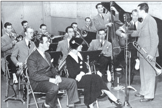
Links vooraan Bob Crosby