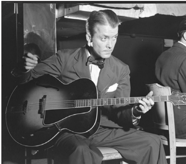
Gitarist Eddie Condon

Muzikaal gezien werd de amusementsmuziek in de tweede helft van de jaren dertig volledig gedomineerd door de grote swingbands van Benny Goodman, Duke Ellington, Count Basie en Artie Shaw. De gebroeders Dorsey, met hun orkesten, sloten daar wonderwel bij aan, met dien verstande dat al deze orkesten zich nog wel enigszins gerelateerd voelden aan de jazzmuziek. Daarnaast vond je natuurlijk wel ontelbare dansformaties, die een soort commerciële dans (swing) muziek ten gehore brachten, die zuiver en alleen bedoeld was om de behoefte aan de 'edele' danskunst te bevredigen. Ontelbare vocalisten passeerden de revue met meer of minder succes. Jimmy Dorsey had het geluk om regelmatig met Bing Crosby op te trekken, maar Kay Weber en Bob Eberly behoorden tot de vaste vocalisten. Tommy kreeg een contract met de Raleigh/Cool (sigarettenmerk) Radio Show, had Edith Wright als vocaliste en gooide zo hoge ogen. Toch werd de hunkering naar de oude jazzstijlen bij groepen muzikanten, die het spelen in grote orkesten beu waren, aan het eind van de jaren dertig duidelijk en ook het