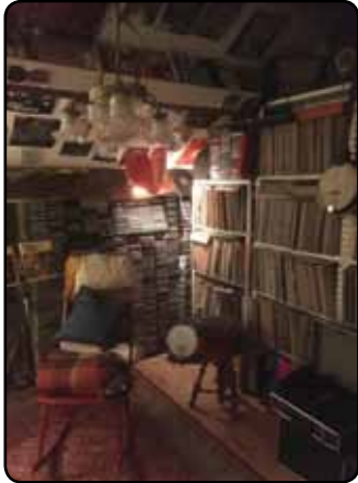
Het privé jazzarchief van Wim Keller

In iedere editie wordt uitvoerig een grootheid uit de jazz(historie) beschreven, gebaseerd op zijn bijna onuitputtelijke privé jazzarchief. In de afgelopen 25 jaar zijn er al 74 artikelen van Wim verschenen. Het wordt dus hoog tijd om de peilstok eens in het rijke oeuvre van deze markante persoonlijkheid te steken.